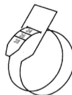
Ejemplo talla 24

Observese que existen dos figuras para medir las tallas, una con las tallas pares y una con las tallas impares.